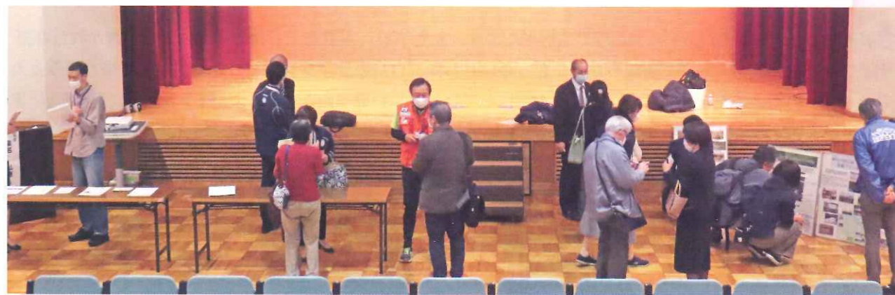
※登壇者・参加者を交えて講演会後の活気ある意見交換(12/11)

暮らし方にも多様な選択肢が増えたなかで、地域との関わりをもちながら、自分らしい人生を考えることはとても大切です。リゾンでは、今後も地域・ひと・応援プログラムを継続的に実施し、地域とそこで暮らす皆様にサポートしていきたいと考えています。